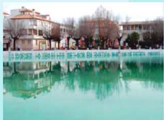
La Charca de Pegalajar ( www.lacharcadepegalajar.com )

Ya tenemos sede en las escuelas del Barrio de Jesús. La estamos adecuando para realizar reuniones y actividades. Estará abierta todos los Viernes, a partir de las 20,30 h.